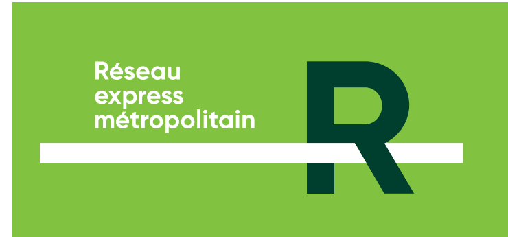
Version en couleur - Renversé